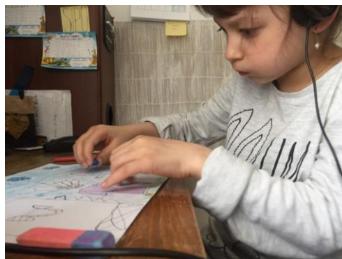
Emička zamyšleně maluje u večerní pohádky