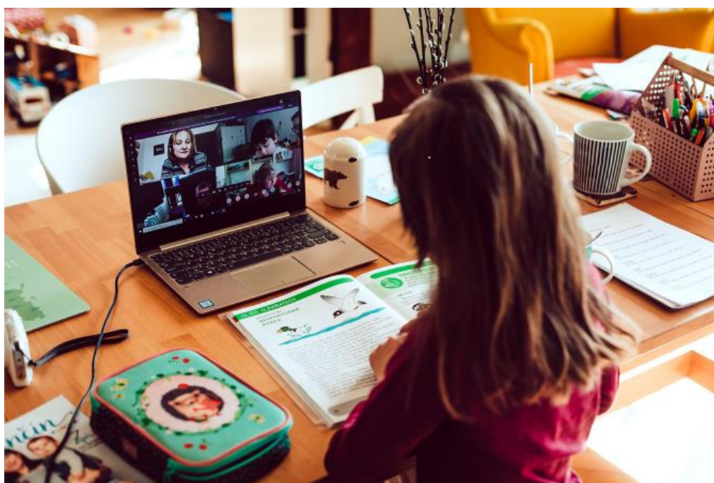
Z online výuky 1. B

„Jinak co se týče online výuky, musím vyjádřit naprostou spokojenost s tím, jak se škola se současnou situací poprala. Online výuka a množství zadaných úkolů je naprosto vyhovující a nemám pocit, že by se dcera jakkoli vlivem této složité situace v učení zpožďovala. Naopak vnímám jeden velký pozitivní dopad toho všeho - za poslední měsíc jsem konečně pochopila, jaký typ podpory má dcera ode mě v učení potřebuje a jak přesně se s ní mám jednotlivé předměty doma učit. Velmi to pomohlo téhle části našeho vztahu a jsem si jistá, že tyhle nově nabyté dovednosti budu velmi využívat i ve chvíli, kdy se výuka zase vrátí do školních lavic. Vnímám to jako jedno velké pozitivum této jinak složité situace.“