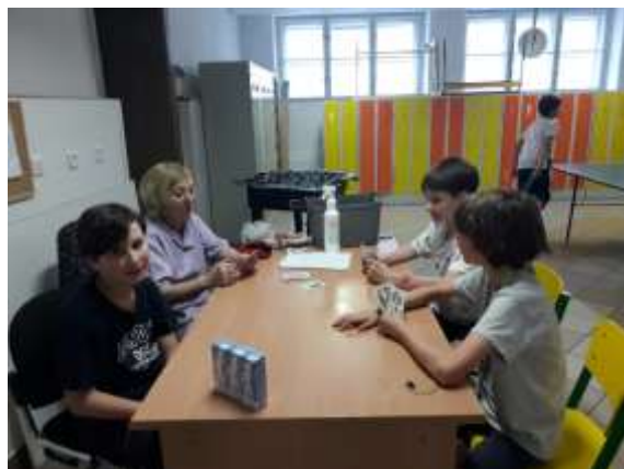
... „mastí“ se karty ... (ovšem pod dohledem!)