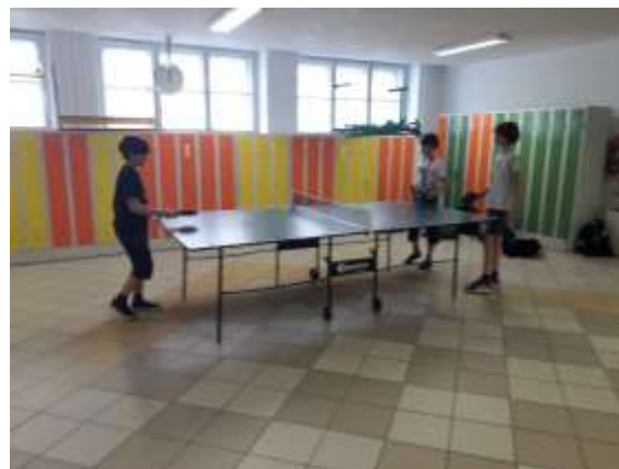
... hraje se „pinčes“ ...