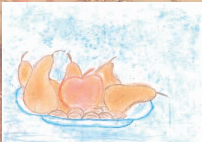
6. A - Vivien Hamzová