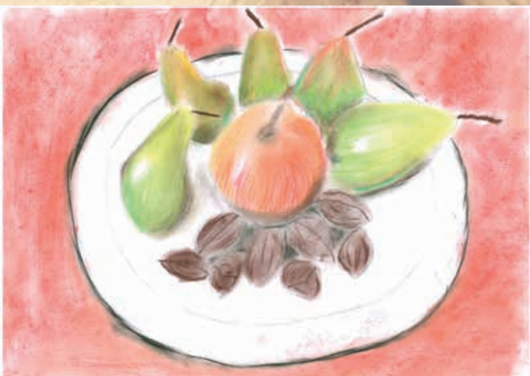
6. A - Tkaczyk Jáchym