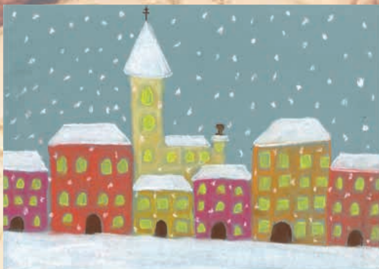
5. C - Žofie Ema Ekrťová