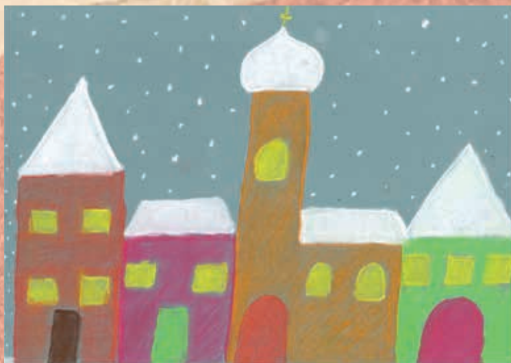
5. C - Natálie Zlámalová