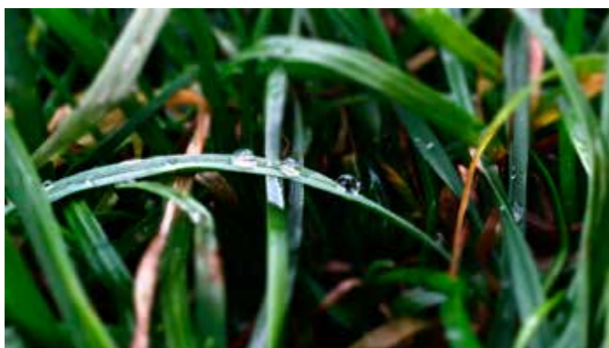
Matyáš Ďuríník, 8. B