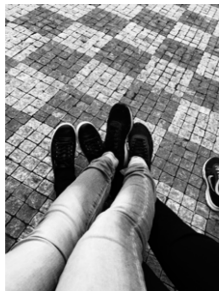
Natálie Čermáková, 8. B

Redakční rada: žáci 9. A a B příspěvky zasílejte na adresu: casopis@zs-ns2.cz