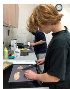
Španělštináři 8. A a 8. B